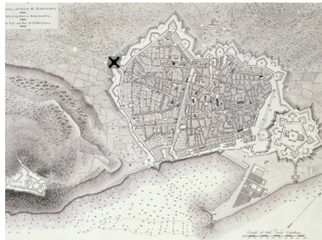
Superposició de l'illa el Mercat sobre un plànol de Barcelona dels XVII / Overlay of the Market block on a 17th century Barcelona's map

The Sant Antoni Market building, designed by the architect Antoni Rovira i Trias and the engineer José M. Cornet i Mas in 1882, is one of the most iconic buildings in Barcelona's Eixample district. It occupies an entire block and is shaped like a Greek cross, its geometry and dimension following that of Eixample's alignments. The Market is located on top of the grounds near the old Sant Antoni's bastion, meaning the area was the access to the walled city from Madrid highway, now called Mistral Avenue.