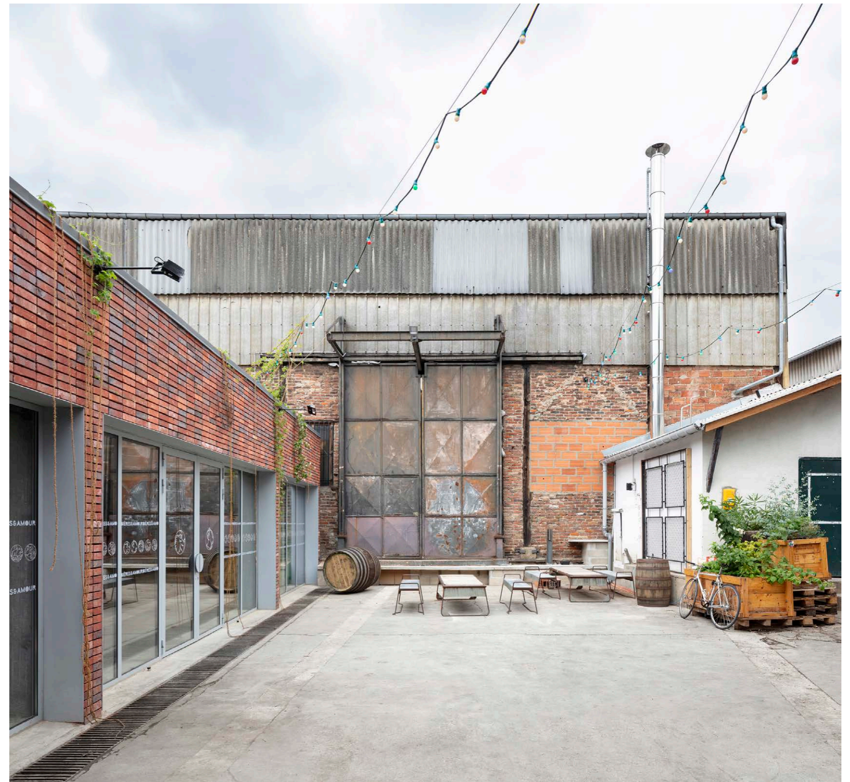
Courtyard and brewery facade