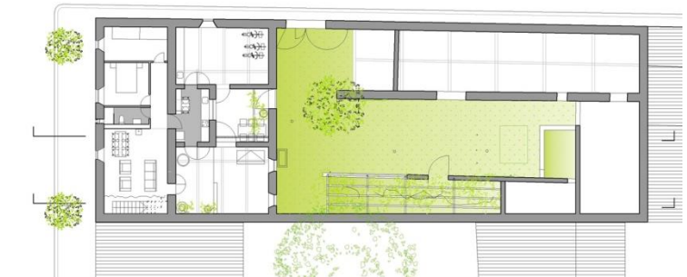
Groundfloor and first floor Plans

Una edificación agrícola y ganadera de principios del siglo XX ubicada en un pueblo de la Meseta castellana de España ha quedado en desuso. La intervención en la edificación existente se plantea como reciclaje de la misma. Se pretende preservar la identidad del espacio productivo y el carácter vernáculo de su construcción.