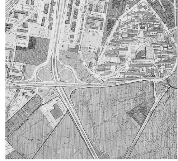
1984 General Municipal Plan - Revision