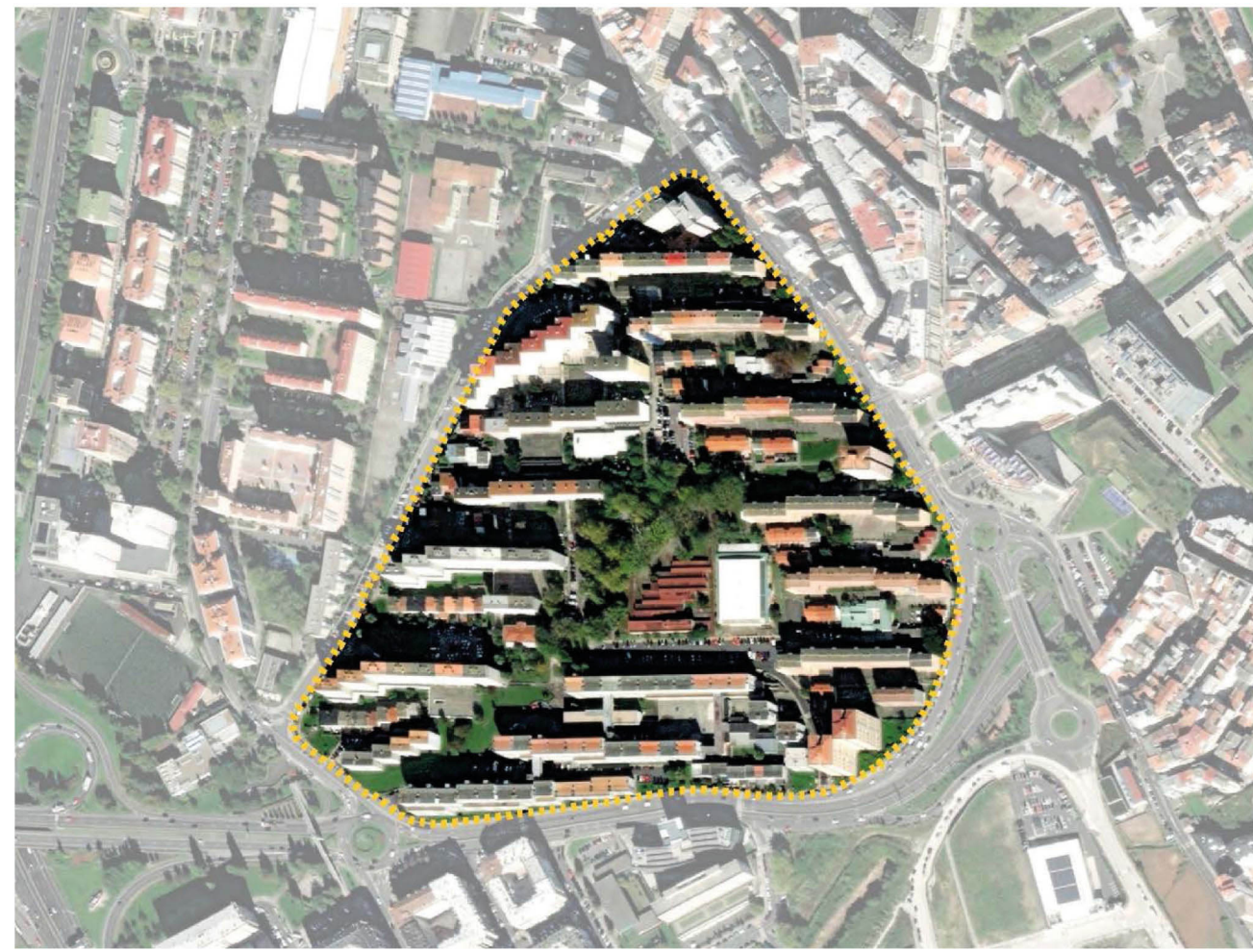
2022 aerial view