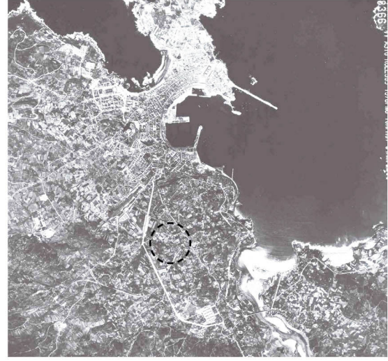
1956 aerial view

Las Flores es un barrio de A Coruña proyectado en los años 60 por reconocidos arquitectos como J.A. Corrales, A. Fernández Albalat, R. Losada, entre otros. La unidad vecinal 3, diseñada por Corrales, recibió el Premio Nacional de Arquitectura en 2001, uno de los ejemplos más destacados de la producción de vivienda durante el Movimiento Moderno en España. Actualmente, pasados más de 50 años, el barrio presenta importantes déficits en habitabilidad y sostenibilidad que dificultan la vida cotidiana de sus habitantes, el 30% de los cuales tienen ya más de 65 años. El Plan director de Rehabilitación Integrada del barrio de Las Flores (PDRI) es una herramienta de regeneración urbana integral impulsada por el Ayuntamiento de A Coruña para planificar las actuaciones de mejora en el entorno urbano, espacio público, viviendas, equipamientos y servicios. El PDRI es tanto una herramienta de planificación, como un instrumento ejecutivo que orienta las futuras intervenciones de regeneración urbana del barrio, para revalorizar su identidad con criterios de sostenibilidad y eficiencia, inclusividad y salud comunitaria. Estos principios se alinean con los objetivos de la Estrategia Integrada de Desarrollo Urbano Sostenible EIDUS Coruña y con los Objetivos de Desarrollo Sostenible de la Agenda urbana 2030.