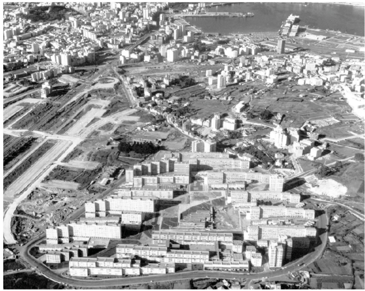
1972 aerial view