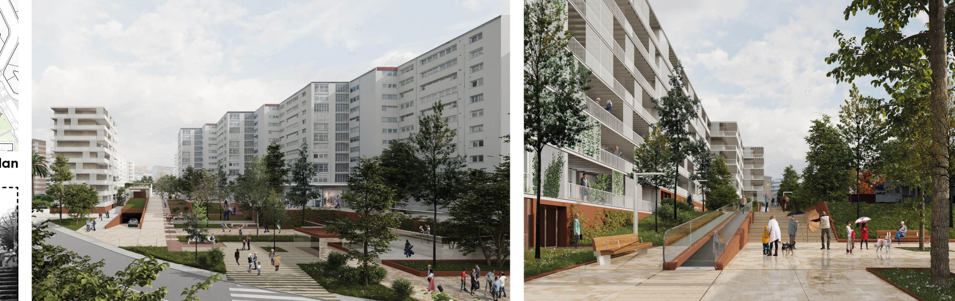
Masterplan and territorialization of the action catalog