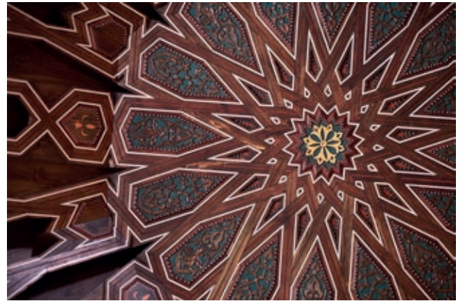
Octagonal "laced" carpentry work with a 16 spokes wheel in the horizontal structure