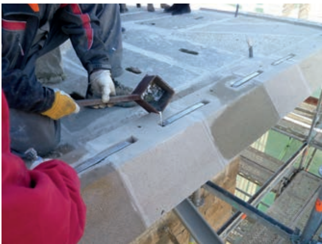
One of the three masters in Spain who knows how to fasten ashlars using iron staples and leaded joints