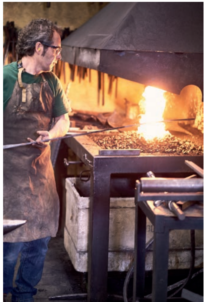
Blacksmith from Alpens, Barcelona