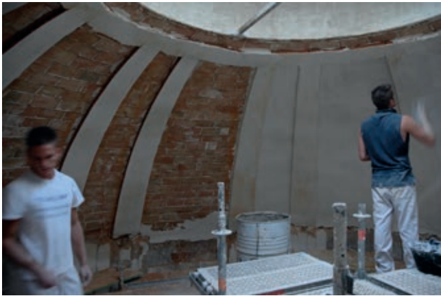
Master vault builder and plasterer working in S. Juan de la Penitencia, Alcalá de Henares, Madrid