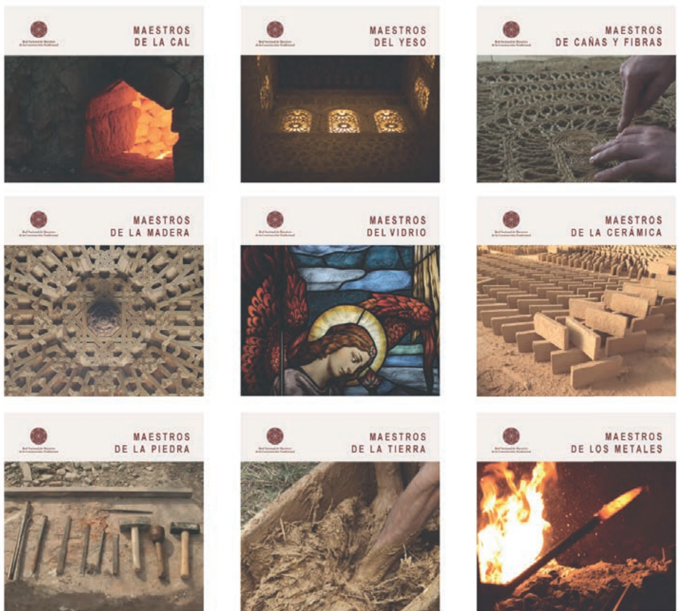
View of the page of the publications

Along with the creation of the website, an additional specific pdf format document on each discipline in the traditional construction has been created and can be downloaded freely from the webpage itself.