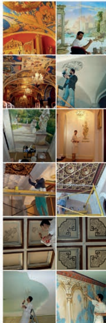
View of the page of one master in finishings

Bata eclesial del convento San Cosme, Zamora (1998) Cafetería Usanuro, Valladolid (1999) Hotel - Edificios Arcaus, Quintanilla de Ocaña (2000) Restauración Brusca en Valladolid (2006) Escuela de Omeida (2006) Botasas, Villa Soriano, Ros, Burgos (2007)