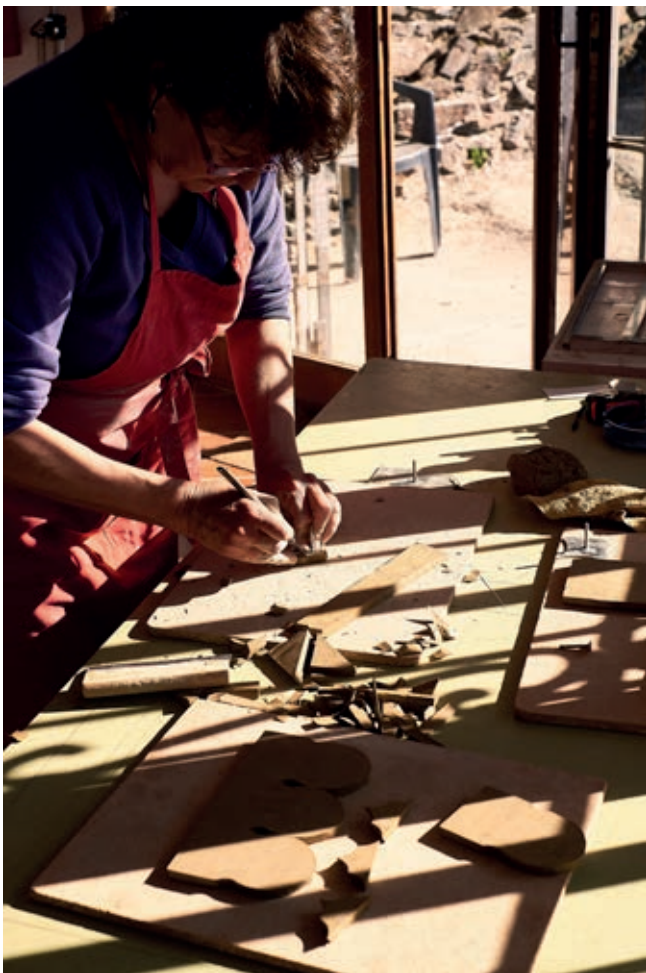
Master in andalusian ceramic tiles working in her workshop in Pitres, Granada

This directory makes these crafts more accessible to society as a whole, thus contributing to the knowledge about them and their valuation. In addition, thanks to the visibility that it provides to the masters included in it, it favours an increase in demand of their work and, with that, supports its continuation and transmission. Of no less importance, is that architects or technicians will be able to locate with greater facility the best experts to realize it satisfactorily.