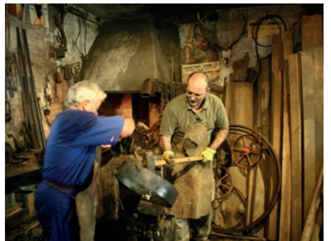
Blacksmith and carpenter working on the restoration of a Fuller in Cantabria